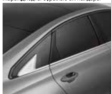
Хромдалған декорациялық элементтер