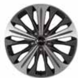
18-дюймдік жеңіл қорытпалы дискілер

Бөлшектер белгілі бір мақсат үшін қолданылады. Kia K8 автокөлігіндегі барлық нәрсе өзінің ерекшелігін енгізеді. Шебер жасалған радиатор торынан бастап жұмсақ күдері мен ішіндегі салтанатты панельдерге дейін. Кейбір бөлшектер батыл немесе ерекше көрініс қалыптастырады. Басқалары - қажет нәрсе. Енді бір бөлшектері тапсырмаларды жаңа әрі жақсы әдістермен орындайды. Біріктірілген бұл бөлшектердің бәрі Kia K8-ге шынымен де жарқырауға мүмкіндік береді.