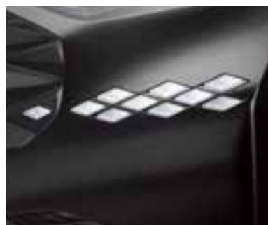
Күндізгі жарықдиодты шамдар / жарықдиодты бұрылыс сигналдары