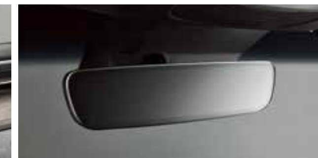
Жақтаусыз артқы көрініс айнасы