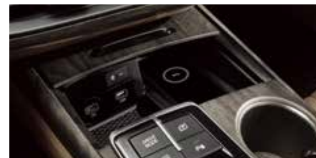
Сымсыз қуат беруге арналған науа