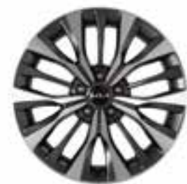
19-дюймдік жеңіл қорытпалы дискілер