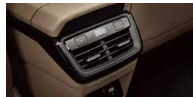
3 аймақты климатты бақылау (артқы орындықтағы климатты