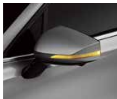
Бүйірлік артқы көрініс айналарына кіріктірілген жарықдиодты қайталағыш