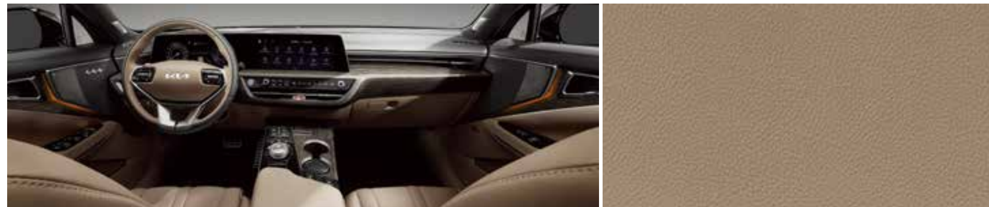
Қоңыр ирис, екі түсті