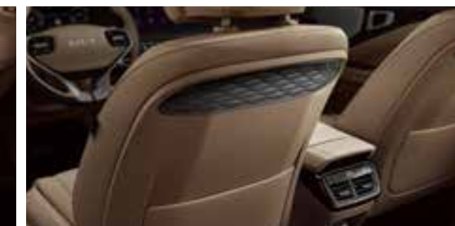
Орындықтың арқасындағы қалта