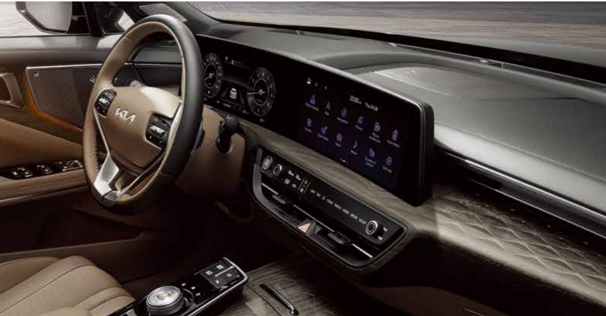
Панорамалық иілгіш дисплей