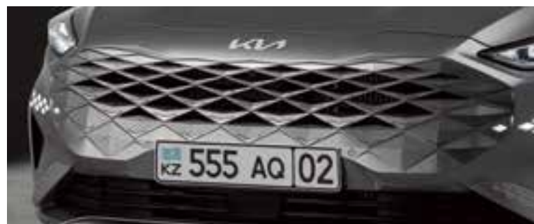
Бамперге біріктірілген радиатор торы