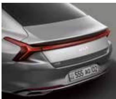
Жарықдиодты артқы аралас шамдар