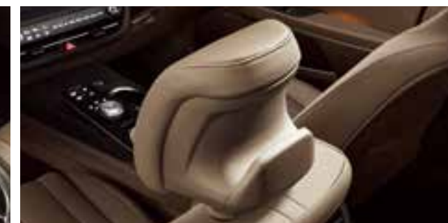
Ілгіші бар бас тірегіш