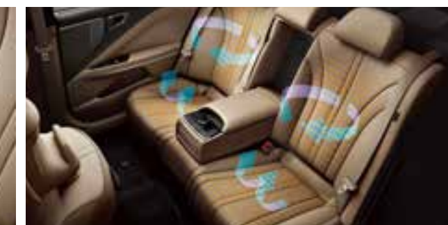
Орындықты желдету/жылыту жүйесі (барлық орындықтар)