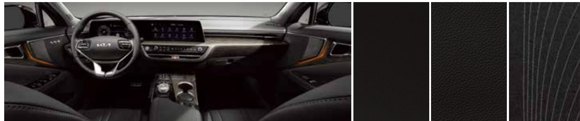
Қара сатурн, бір түсті