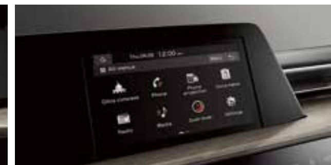
Аудиоплеердің 8-дюймдік дисплейі