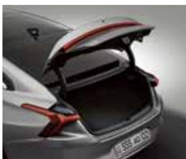
Автоматты түрде ашылатын электрлік қауіпсіз жүк салғыш