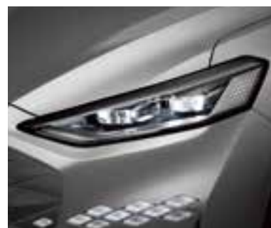
Проекциялық жарықдиодты фаралар