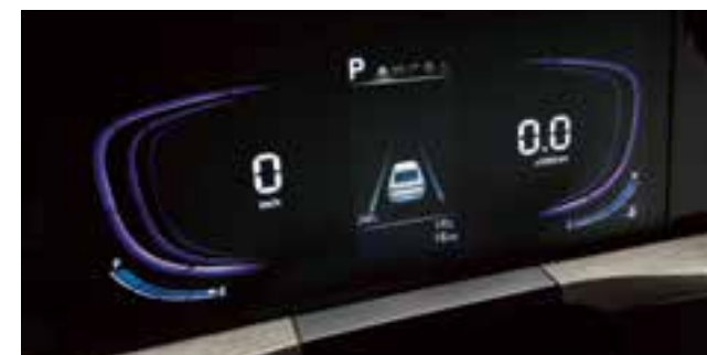
Басқару панелі (4,2-дюймдік түрлі түсті TFT СК-дисплейі)