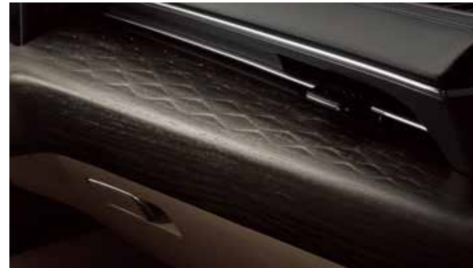
Премиум санатты ағаш және шашыраңқы жарық Берілістерді электронды түрде ауыстырып-қосу

Жылтыратылған ағаш. Суреті бар жұмсақ былғары. Жылтырсыз, хромдалған бөлшектер. Талғампаздық - Kia K8 автокөлігінің ажырамас бөлігі. Сәл бүгілген кең панорамалық дисплей бәрінің ортасында болуға мүмкіндік береді. Ағаштың бай құрылымы жайлы сән-салтанат жағдайын қалыптастырады. Ergo Motion орындықтары барынша жайлылыққа қол жеткізуге, шаршаудың алдын алуға көмектесетін реттелетін ауа қалталарының арқасында дене қалпын оңтайландырады.