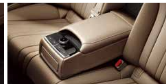
Артқы орындықтағы шынтак қойғыш