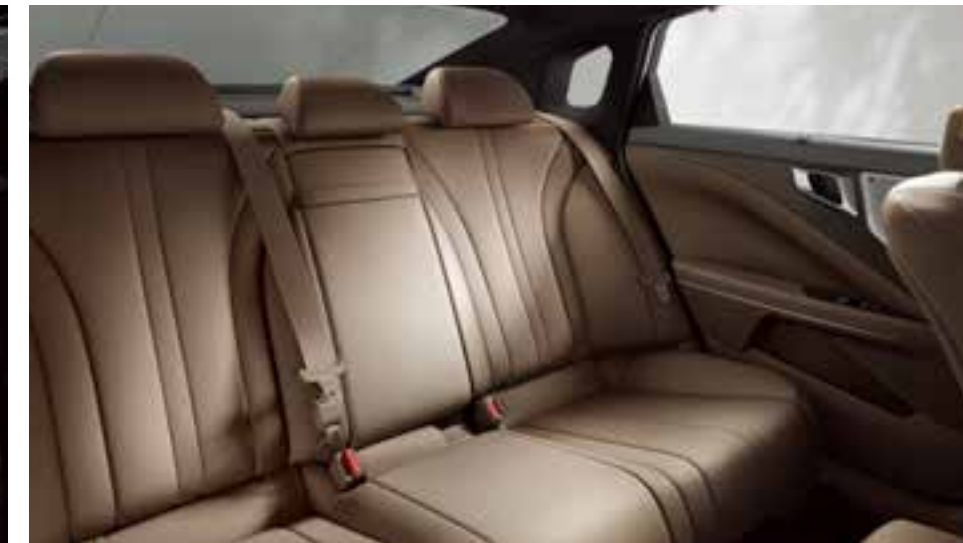
Премиум санатты былғары орындықтар Эргономикалық Ergo Motion орындықтары